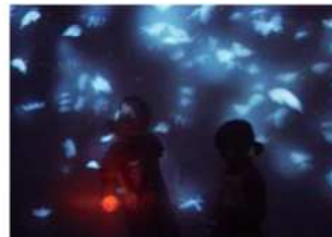
Phantasm (2006) ファンタズム

暗闇の深海で淡く青い光を放つクラゲの群れ。手や身体を近づけると連鎖的に発光し、共鳴する。