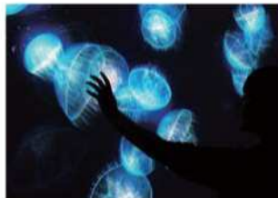
Aquatic Colors (2009) アクアティック・カラース

光と音楽がおりなす幻想空間の中、あなたのうごきに合わせて作品の表情が変わるインタラクティブアート。あなた自身が作品の一部となって楽しめる参加型アートの世界を、家族みんなで体験してみよう。