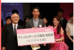
テレコムサービス協会会長賞 (ドレミングアジア)

自分の主張を的確に表現すること。インカムをつけ舞台を自由に動き、自分のプレゼンにあったスタイル&パフォーマンスを期待しています。