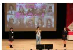
女性起業家大賞 (うまぶぶ)