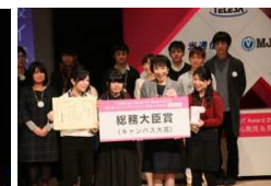
総務大臣賞 (ピアの極み乙女、)