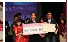
中小企業長官賞 (スタディスト)